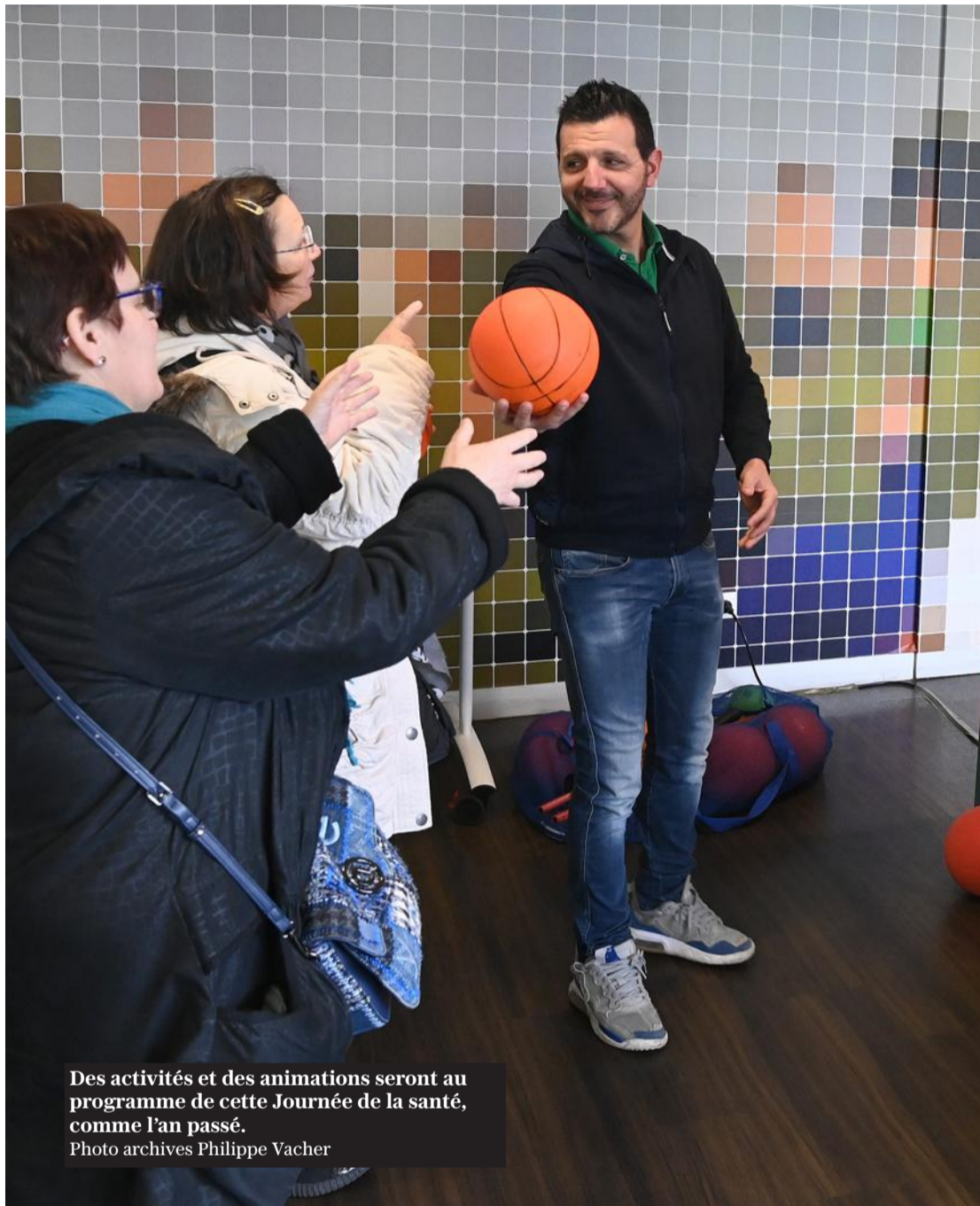
Des activités et des animations seront au programme de cette Journée de la santé, comme l'an passé.