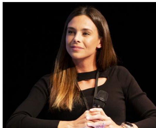
Marine Lorphelin, médecin généraliste, auteure et ancienne Miss France sera présente.