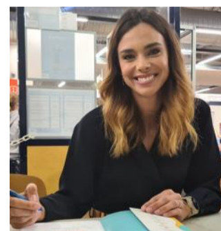
Marine Lorphelin va participer à une conférence et dédicacer son livre.

Partenaire : CHU St-Etienne 16 h 05 - 16 h 45 : Santé mentale chez les jeunes (violences, addictions, anorexie, obésité...)