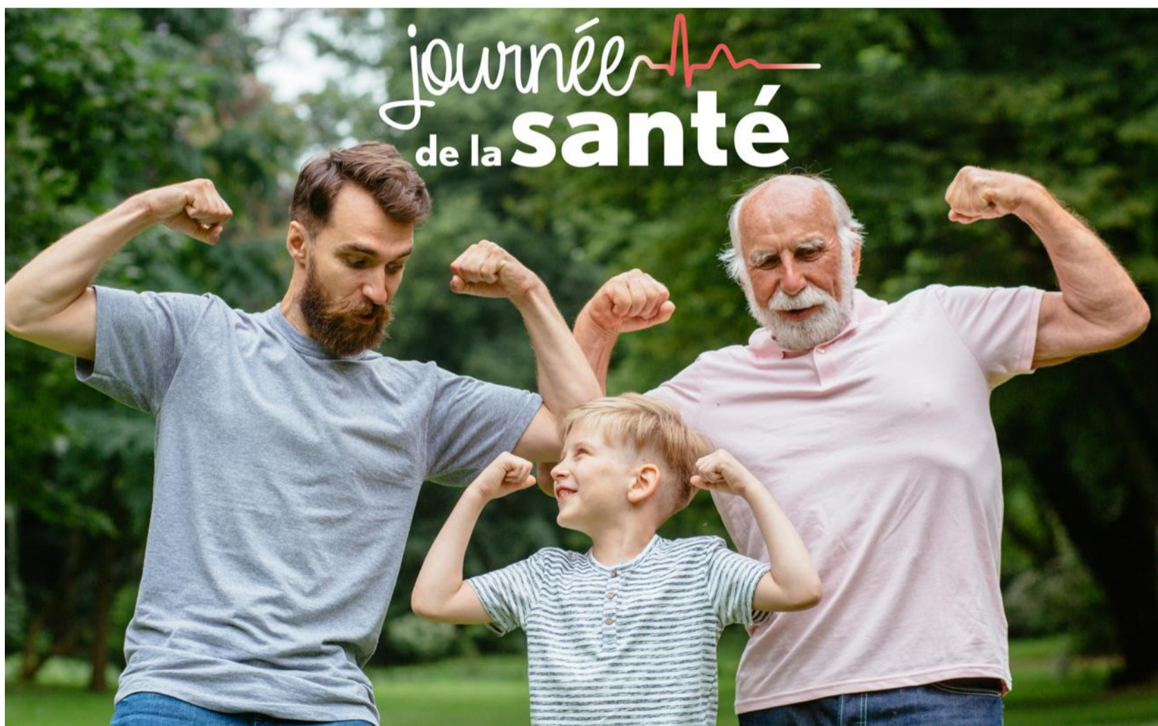
La Journée de la santé réunit au stade Geoffroy-Guichard des exposants, des conférences, des tables rondes et des animations.