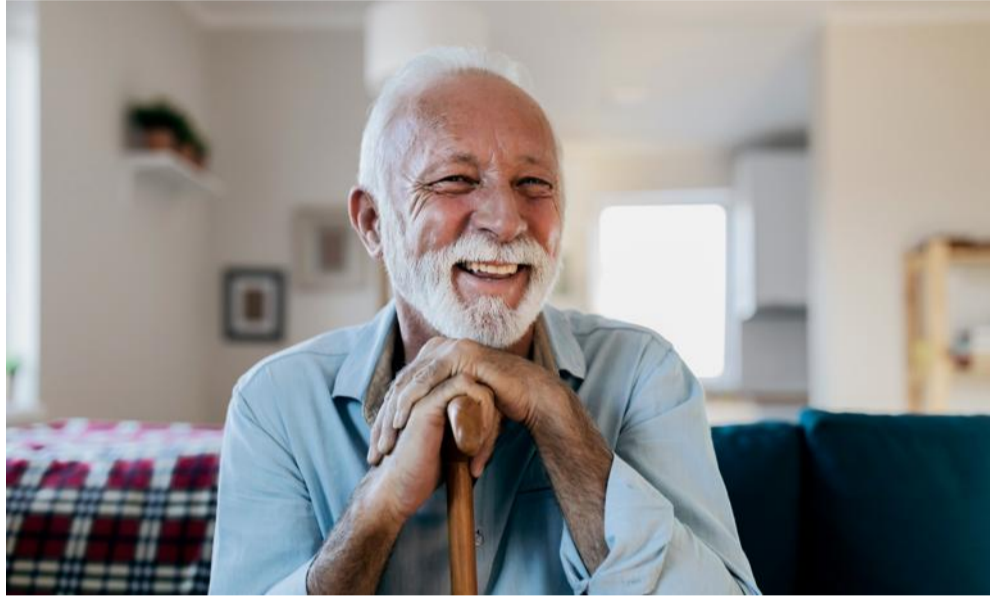
Le CETAF a développé un Score de Risque de Chute (SRC) permettant aussi d'accompagner les seniors vers la meilleure prise en charge.

« Nous œuvrons principalement pour les Centres d'exams de santé de l'Assurance Maladie (CES). Ces centres réa-